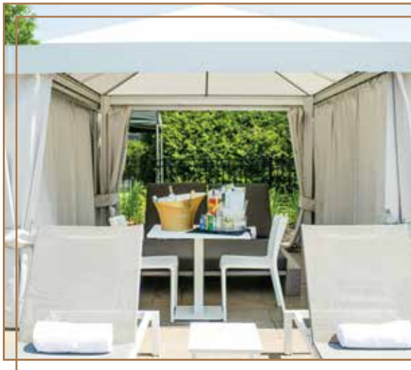
TENTE GAZEBO / GAZEBO TENT