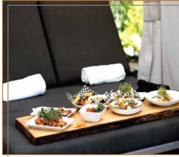
LIT DE JOUR / DAYBED